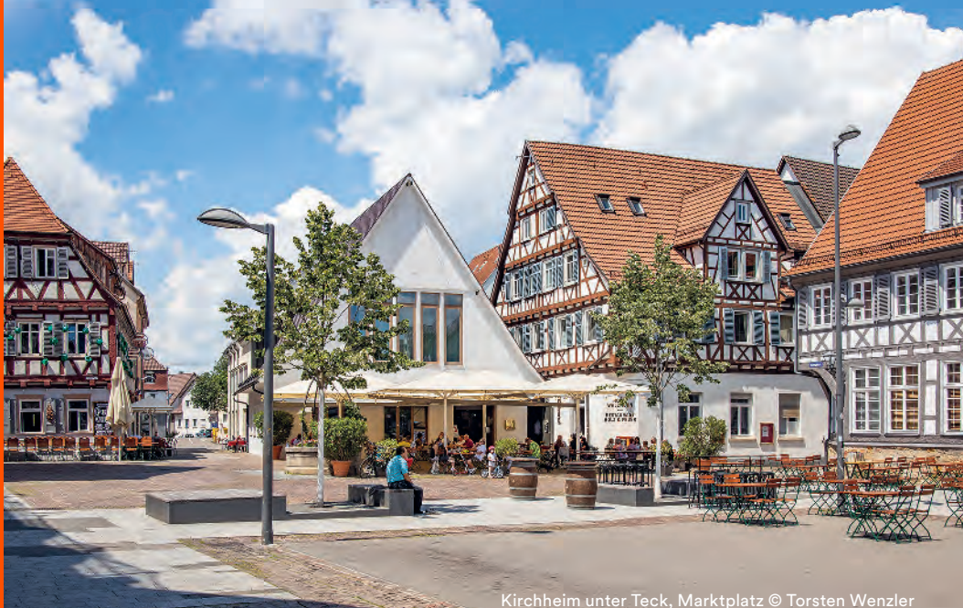
Kirchheim unter Teck, Marktplatz