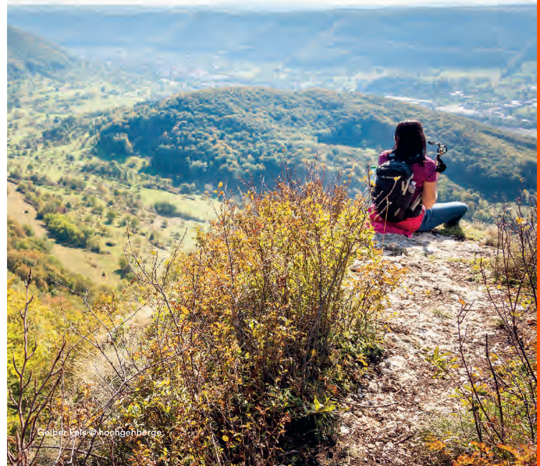
Gelber Fels

Verbindung: S1 ab Stuttgart Hbf nach Kirchheim (Teck), weiter mit Bus 175 bis Bissingen (T) See, Halbstundentakt.